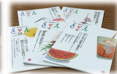
写真：糖尿病学習会、糖尿病情報誌『さかえ』を読む会の様子