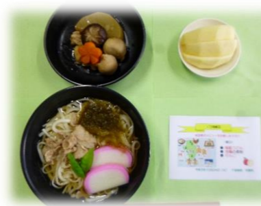
ご当地献立 (秋田県)