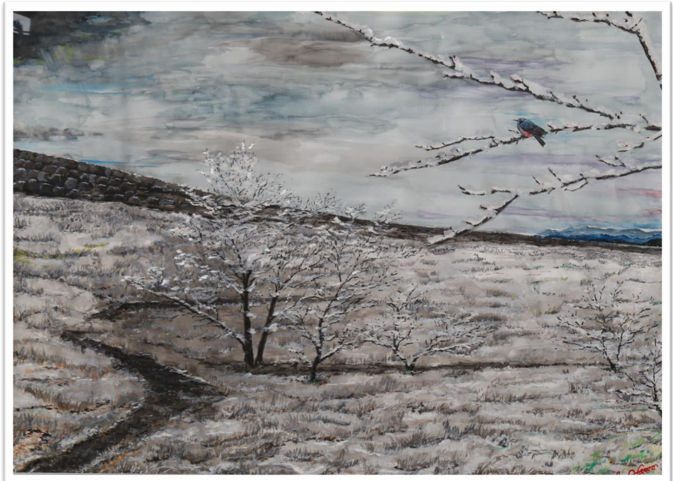
作：外科 大澤明彦医師